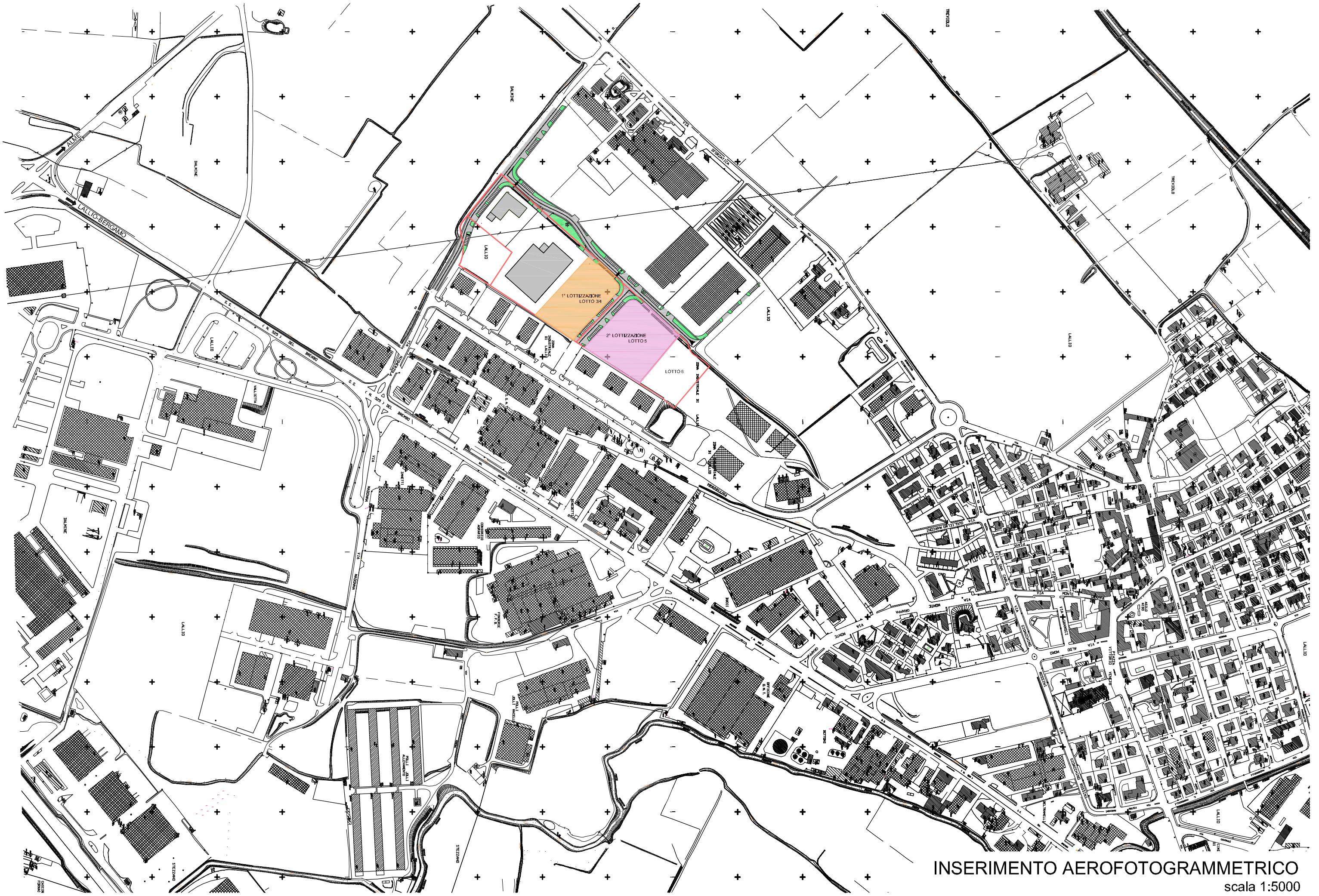
INSERIMENTO AEROFOTOGRAMMETRICO scala 1:5000