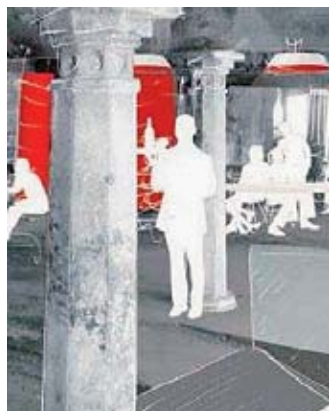
Nel progetto anche un ristorante